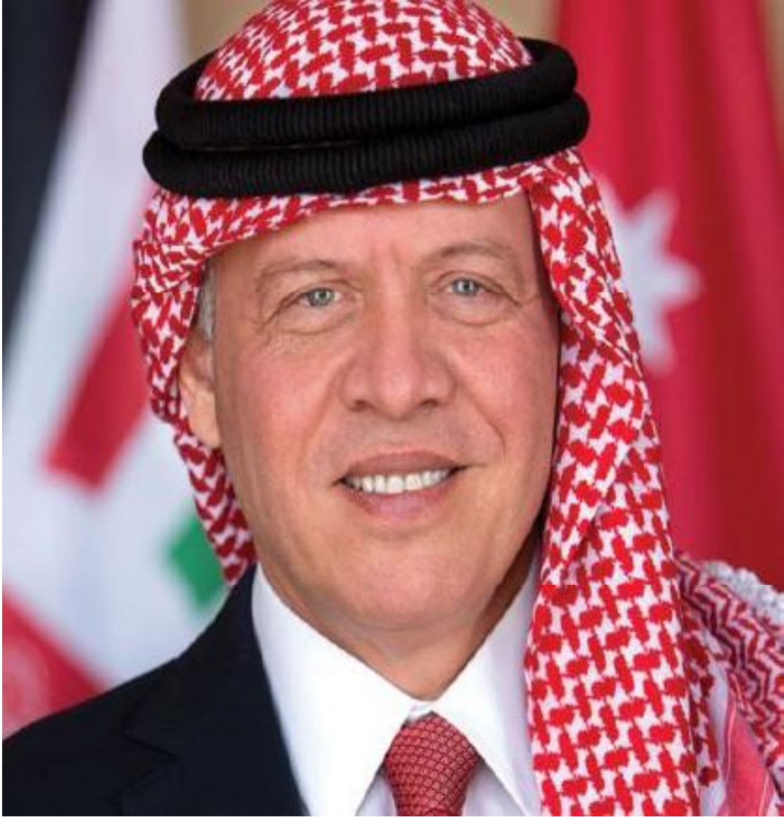
صاحب الجلالة الهاشمية الملك عبدالله الثاني بن الحسين المعظم