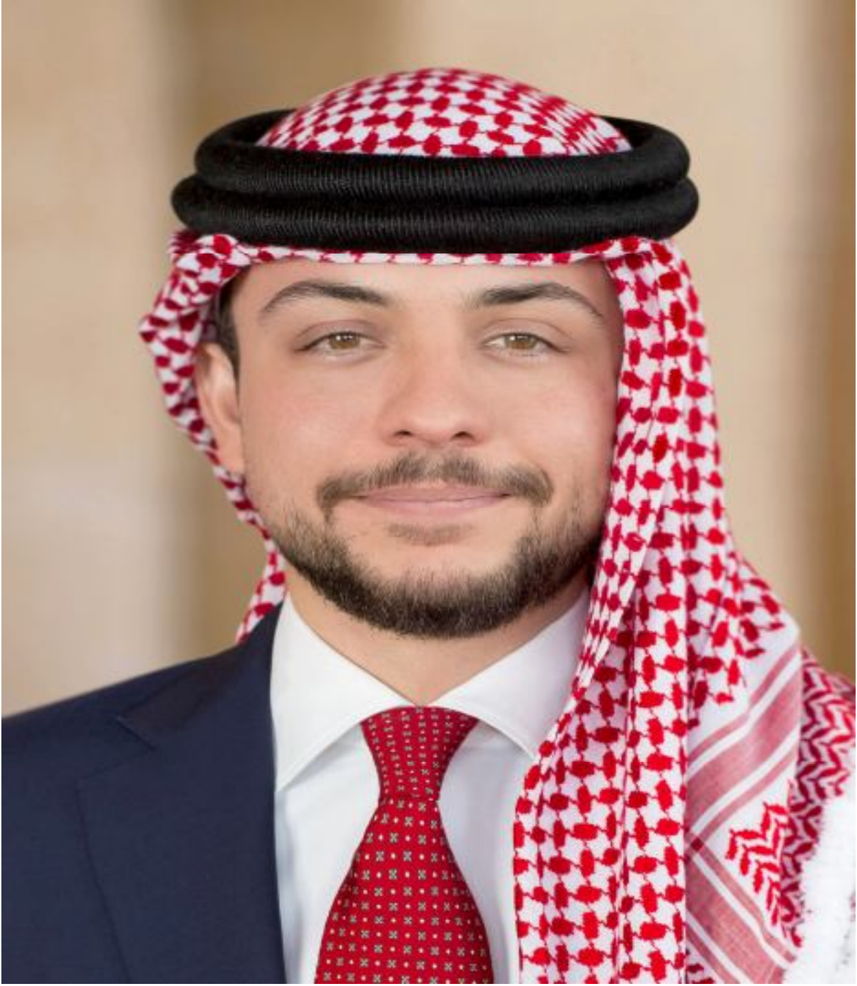
صاحب السمو الملكي ولي العهد الأمير الحسين بن عبدالله الثاني